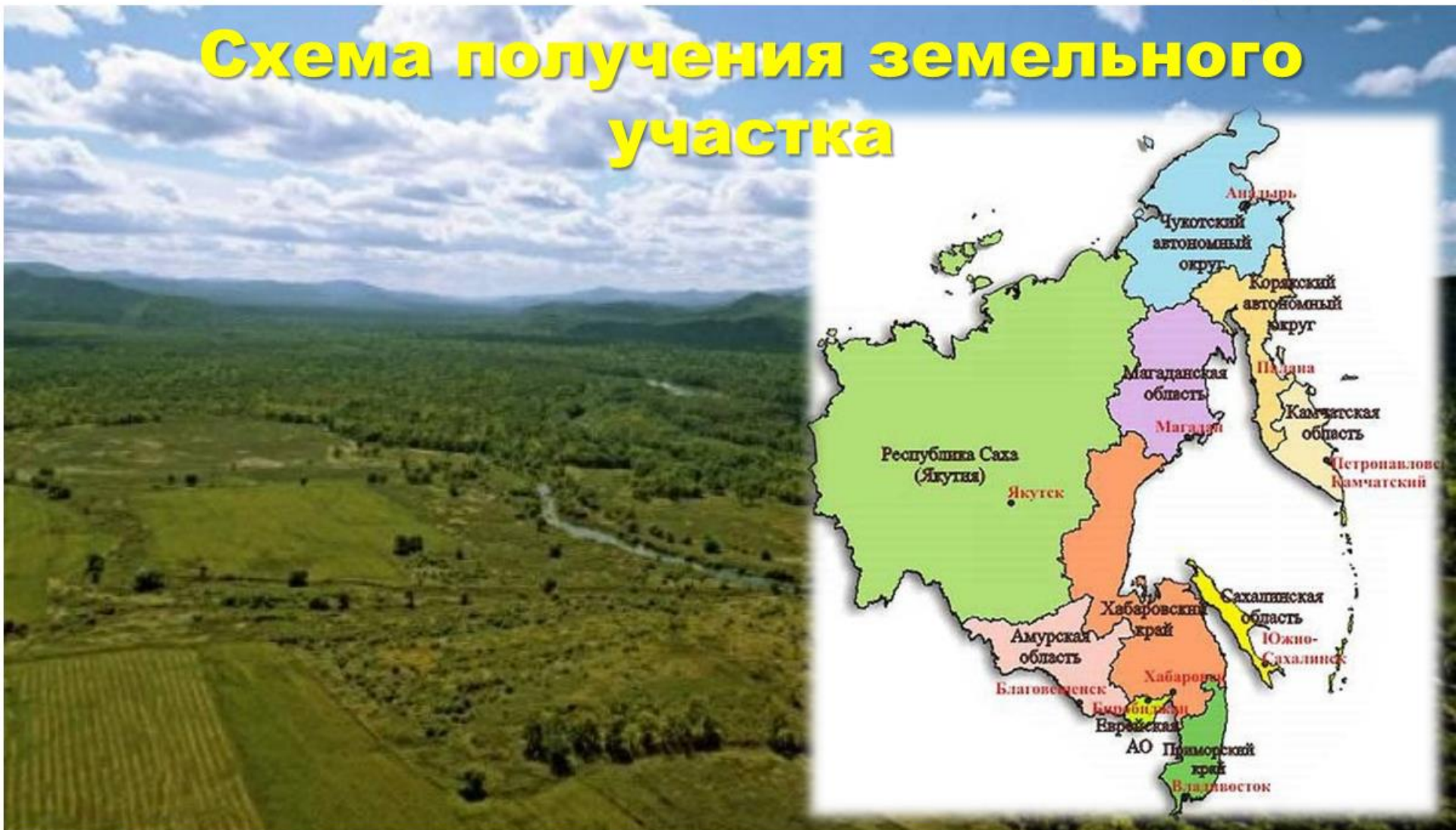
Схема получения земельного участка

*Федеральный закон от 01.05.2016 № 119-ФЗ «Об особенностях предоставления гражданам земельных участков, находящихся в государственной и муниципальной собственности и расположенных на территориях субъектов Российской Федерации, входящих в состав Дальневосточного федерального округа, и о внесении изменений в отдельные законодательные акты Российской Федерации»